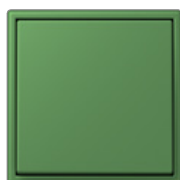
vert foncé 32050