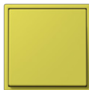
vert oliv vif 4320F