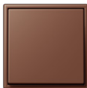
terre sienne brûlée 59 4320D