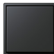
ombre naturelle 31 32140