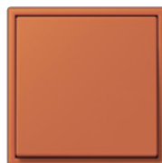
orange vif 4320S