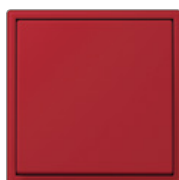
rouge vermillon 31 32090