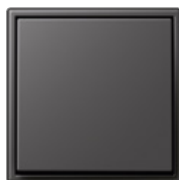
ombre naturelle 59 4320R