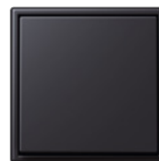
terre d'ombre brûlée 59 4320J