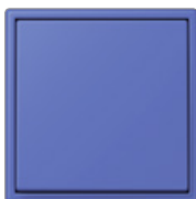
bleu outremer 59 4320K