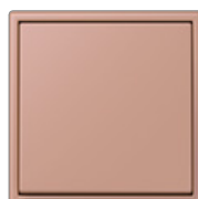
terre sienne brique 32121