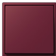
es rubis 4320M