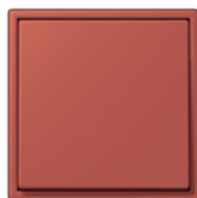
rouge vermillon 59 4320A