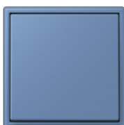
bleu céruléen 31 32030