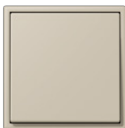
ombre naturelle claire 32142