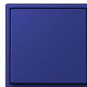
bleu outremer foncé 4320T

Eine Übersicht der lieferbaren Farben finden Sie auf www.jung.de/Les-Couleurs .